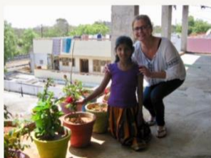
March 2016 Proud member of the Gardening Club