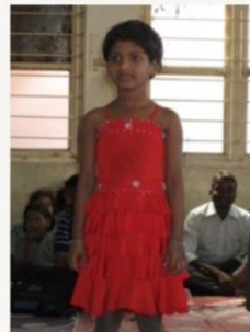
February 2013 Opening up, speaks English