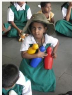
May 2011 Just arrived, No contact with others