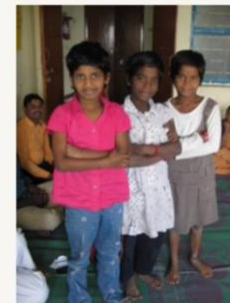
November 2014 Fully integrated, many friends