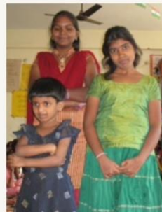
February 2012 In sister committee, Still keeping some distance