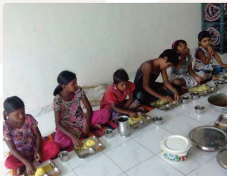
De eerste Rainbow meisjes in Pune

In Patna hebben de meisjes mee gedaan aan een dansfeestje georganiseerd door de lokale overheid. In Hyderabad is een groep meisjes door naar de finale van een toneel-competitie die is uitgeschreven door de deelstaat. Voor het eerst heeft een aantal Rainbow meisjes deelgenomen aan door de overheid georganiseerde zomerkampen. Een mooi teken van verdere integratie en acceptatie. De aanvullende onderwijs-activiteiten waren gericht op life skills (emoties, relaties met anderen, koken e.d.) en Engels, beide belangrijk voor de toekomst van de meisjes. Zo is het bijvoorbeeld voortaan mogelijk om met alle meisjes in het Bosco Rainbow Home in Bangalore een gesprekje te voeren in het Engels.