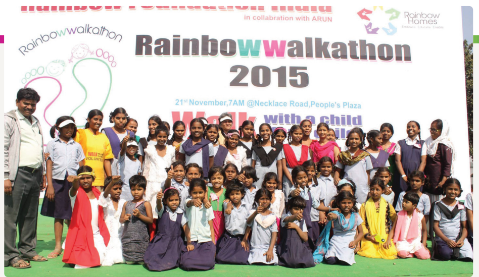
Blijde meisjes bij de Walkathon in Hyderabad

Voor het eerst dit jaar organiseerde Rainbow Foundation India 'Walkathons' in Hyderabad en Bangalore, waarbij deelnemers met en voor de Rainbow meisjes konden wandelen. Naast het vergroten van de zichtbaarheid van de Rainbow Homes, waren de evenementen ook gericht op het werven van fondsen door middel van crowdfunding. Onder de deelnemers waren veel lokale bekendheden uit de muziek- en filmindustrie,