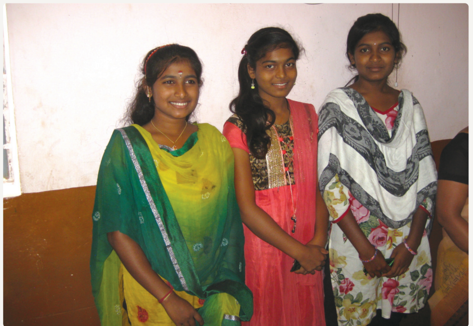
Oudere meisjes Bangalore

meisjes konden kiezen tussen een bakkerscursus, een naaicursus, een training tot schoonheidsspecialist en een computercursus. Tevens wordt er samengewerkt met Tata Metaliks om de oudere meisjes korte trainingen te bieden, die ze helpen bij het vinden