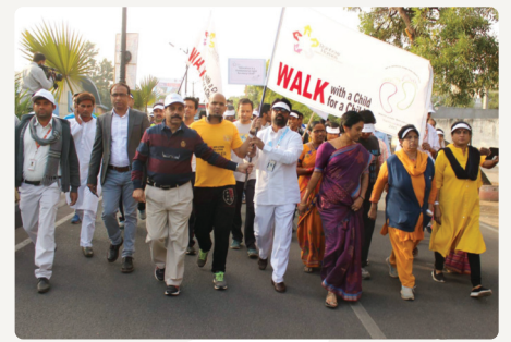
Deelnemers aan de Walkathon in Hyderabad

schrijvers, journalisten en Indiërs die in het buitenland wonen. De Minister van Binnenlandse Zaken van Telangana (nieuwe deelstaat van Hyderabad) was eregast en opende de Walkathon in Hyderabad. Ieder Home had een eigen stand met informatie en knutselwerkjes van de kinderen. Ook deze evenementen hebben veel media aandacht gekregen, zowel in de geschreven pers als op de lokale televisie.