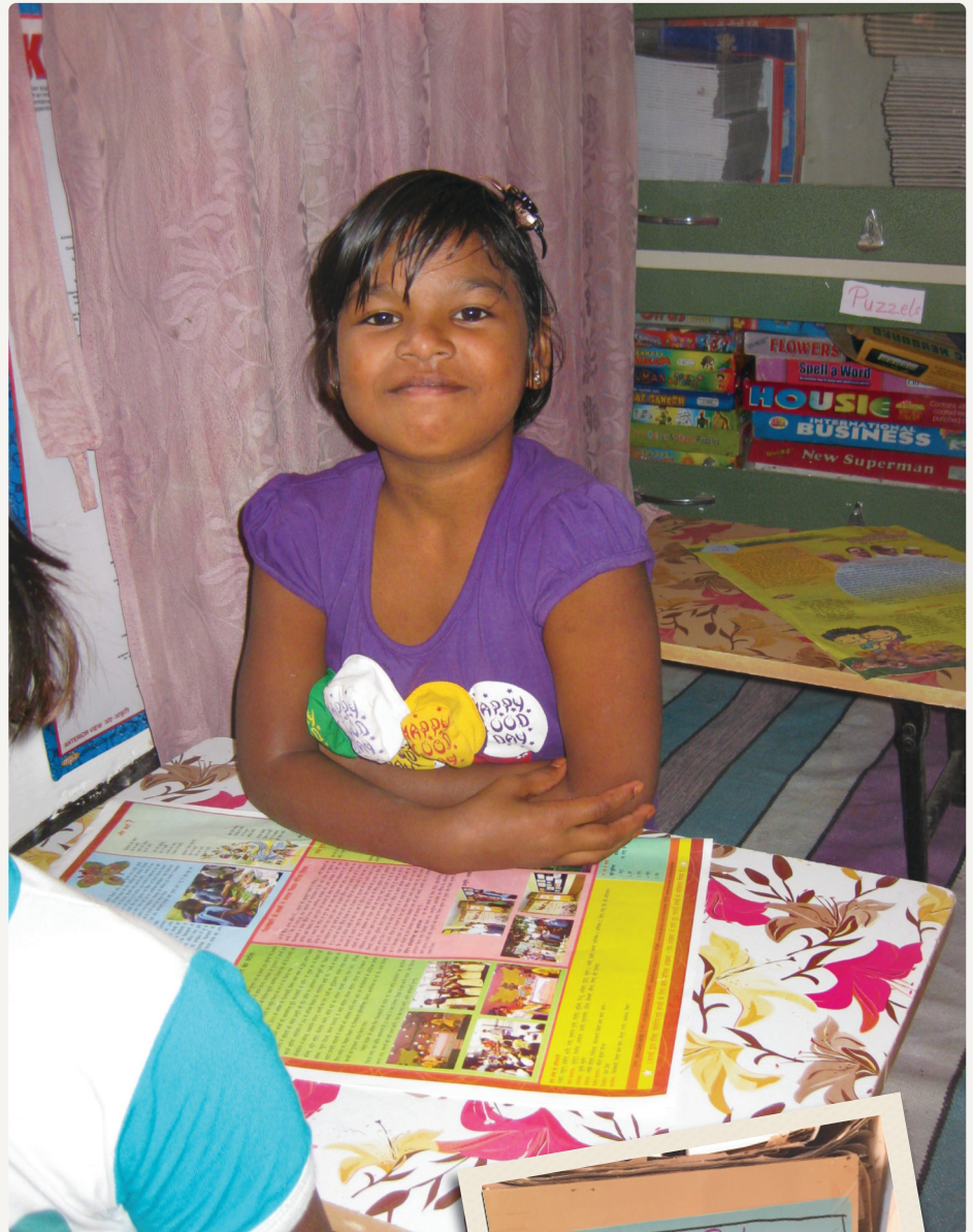
Bibliotheekje in een Patna Home

In het Bosco Rainbow Home in Bangalore hebben de meisjes met steun van een Nederlandse sponsor een nieuwe slaapruijnte en een leslokaal gekregen. Dit Home was erg krap voor het aantal meisjes dat er woont. Door de uitbreiding op het dak van de school, hebben de meisjes voortaan alle ruimte om te leren en hebben ze een veilige en prettige plek om te slapen.