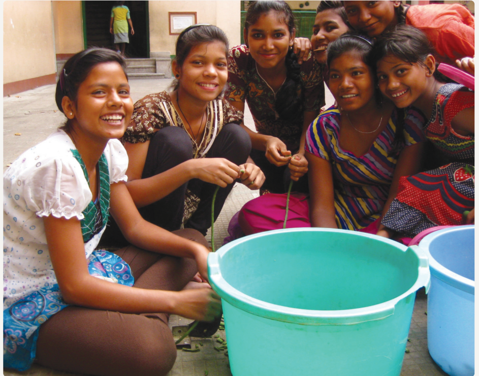
Oudere meisjes in Kolkata bereiden eten voor

In Kolkata hebben achttien meisjes hun 12 th Standard examen gedaan (vergelijkbaar met het Nederlandse HAVO-diploma), waarvan er zeventien geslaagd zijn. Negen meisjes hadden '1st division' resultaten en één zelfs 'star marks'. Het is heel bijzonder dat deze Rainbow meisjes met veel minder onderwijsjaren dan reguliere scholieren, dit soort mooie resultaten bereiken. De meesten gaan inmiddels naar een college. Daarnaast is er in Kolkata een vocational training georganiseerd, waarbij de